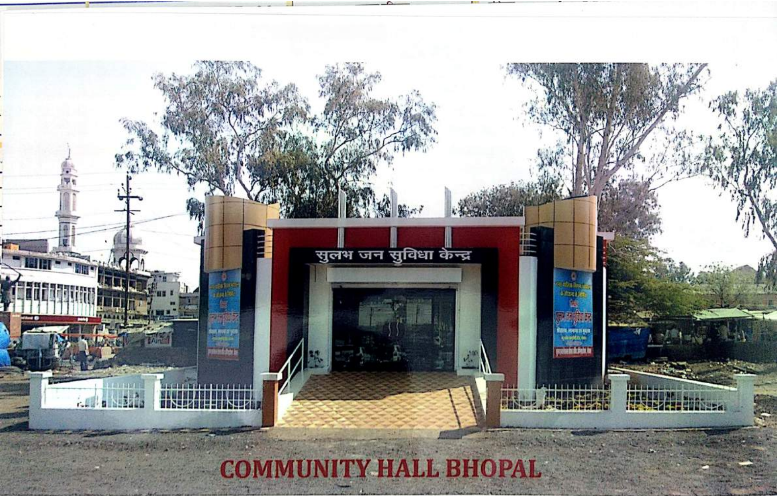
COMMUNITY HALL BHOPAL