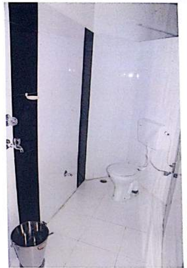
DELUX SULABH COMPLEX NEAR MANISHA MARKET BHOPAL